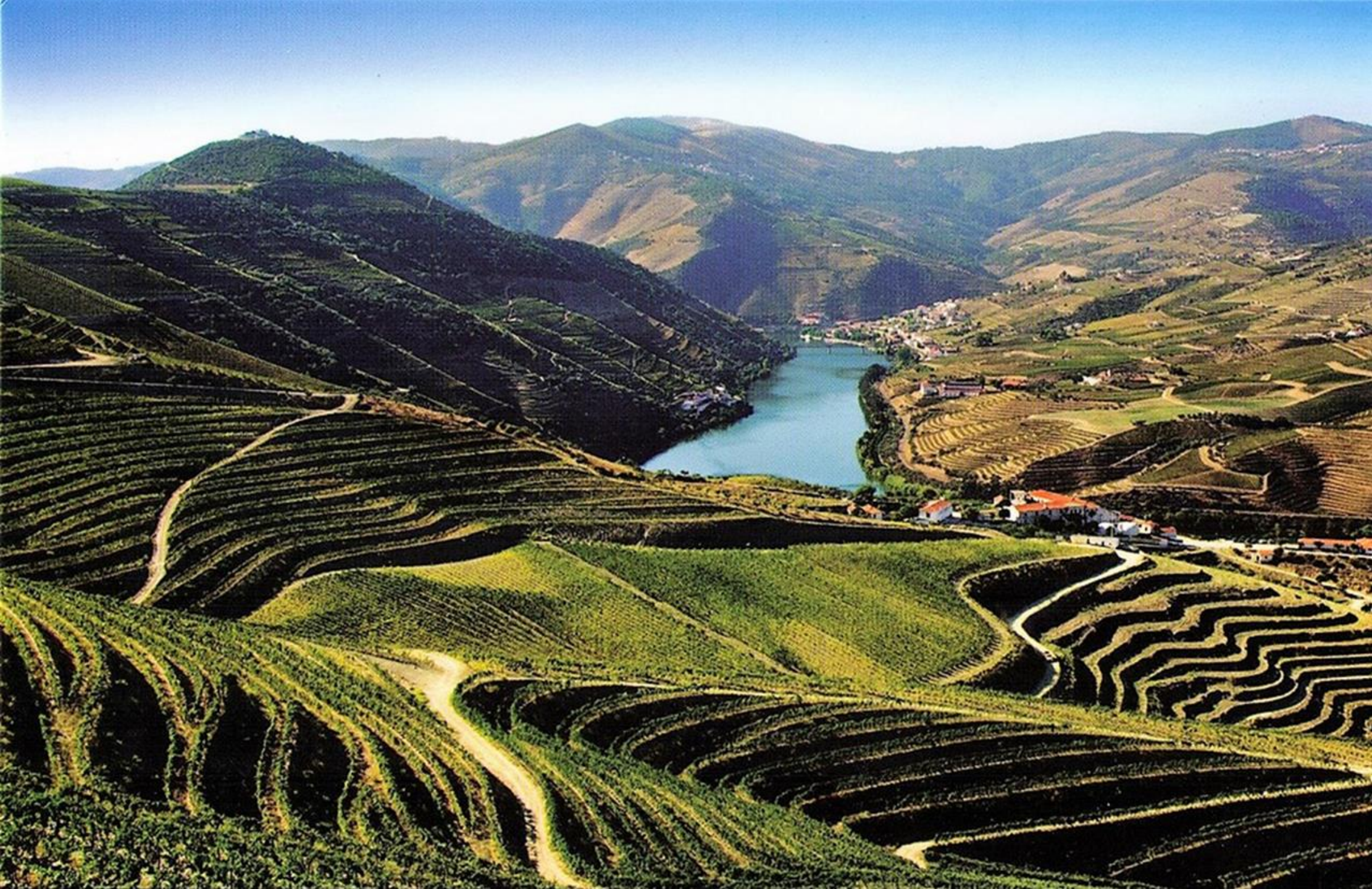
Alto Douro Wine Region, Portugal