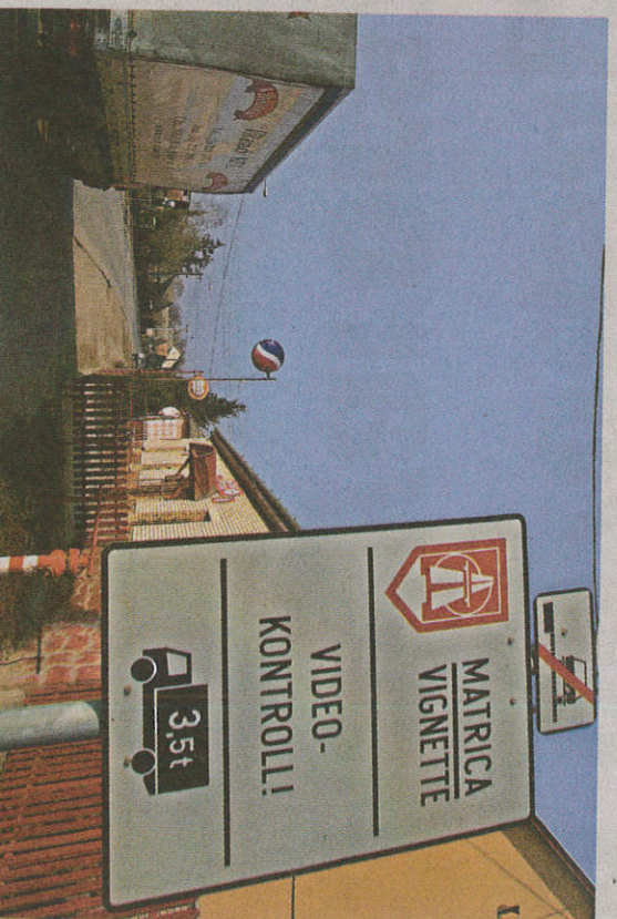
A közlekedők tele januárban váltja meg az úthasználati jogosultságot

keresztül is megvásárolhatók. Az országos éves matrixa ára 2012 óta, a megyei matrixák ára pedig 2015-ös bevezetésük óta nem változott. A DI kategóriába sorolt gépjárművekkel – ide tartoznak a motorokérpárok, a személyautók és azok pótkocsijai – az éves országos matrixa ára 42 980 forint, a megyei matrixa ára pedig ötezer forint. A nagycsaládok részleges díjmentességre jogosultak, kedvezményes e-matrixa vásárlásához azonban minden év január 31-ig be kell jelenteniük a közlekedési igazgatósági hatóság nyilvántartásába az általuk üzemben tartott gépjárművet. A NÚSZ Zrt. a matrixák gyors megvásárlásához a weboldalkat ajánlja, ahol kényelmi díjat nem számolnak fel. ■